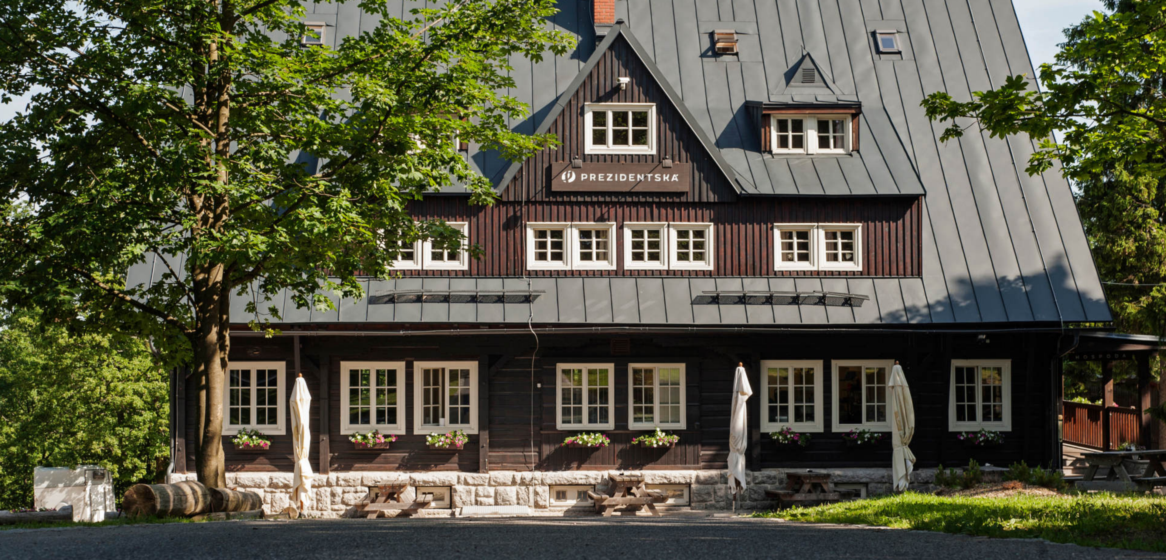
PREZIDENTSKÁ chata v Jizerských horách