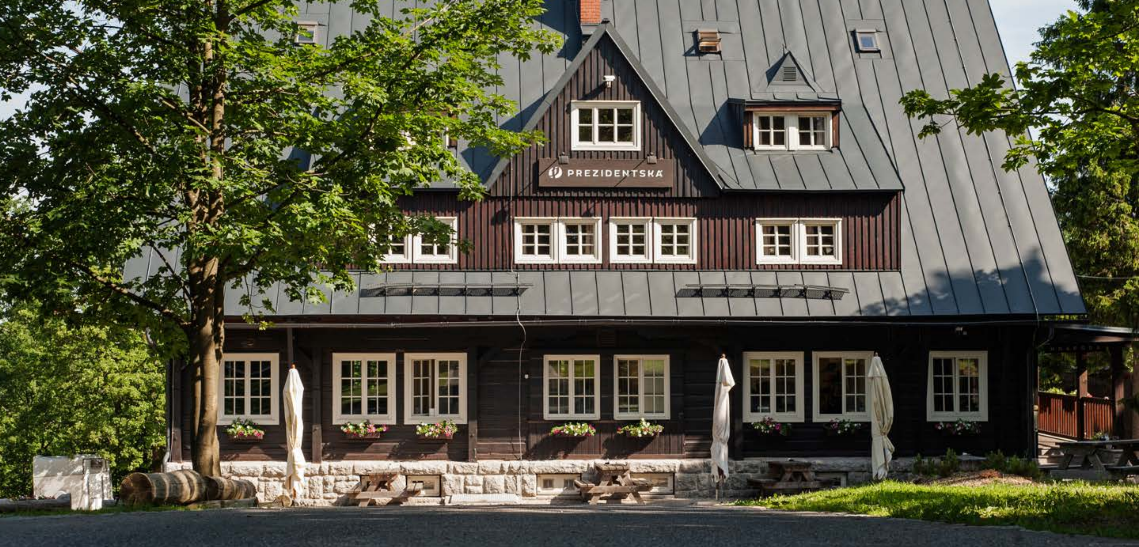
PREZIDENTSKÁ chata v Jizerských horách